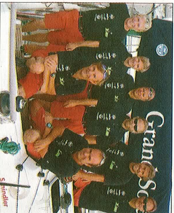
Passé fornøyd: Gutta på Team Xtreme reiste til VM for å lære, og det gjorde de selv om de var litt misfornøyd med plasseringen.